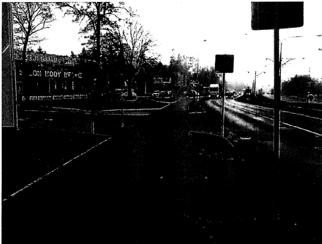
Ul. Nawrot – wyznaczenie przejazdu z fragmentu obecnego przejścia dla pieszych