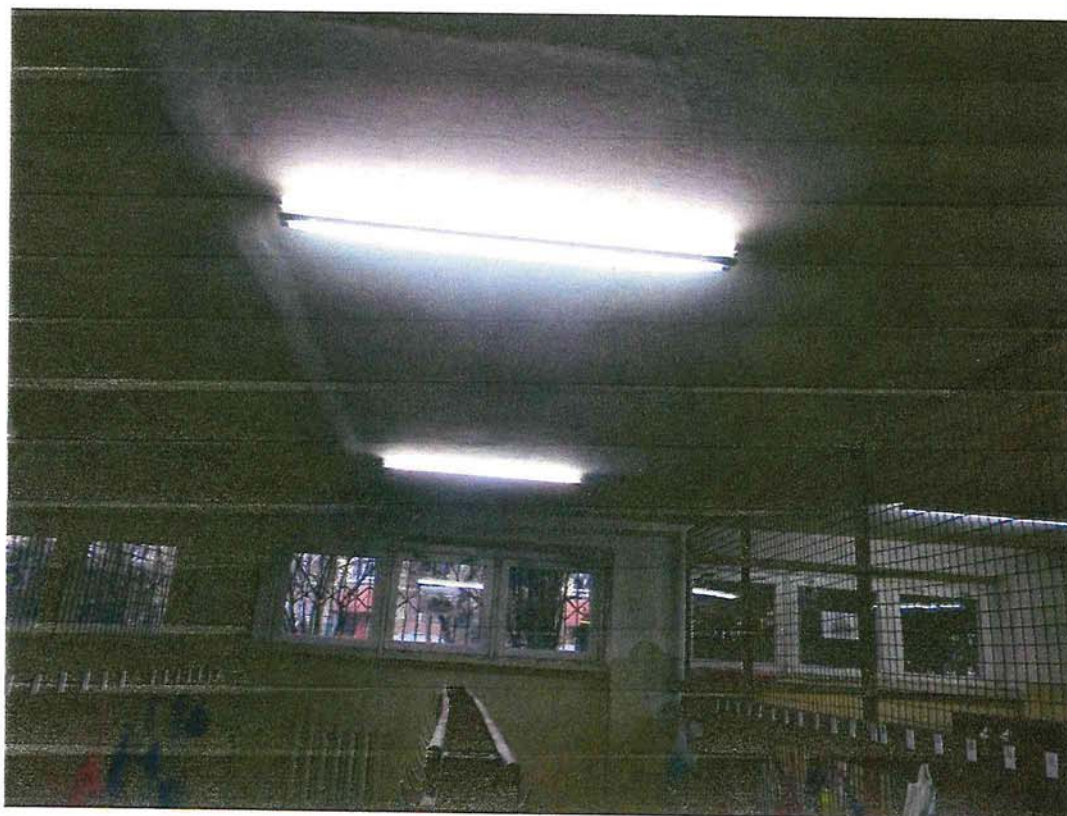
Zdjęcie nr 6